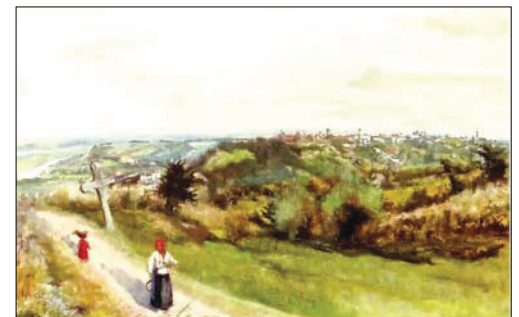
Вид на Краків. Акварель, гуаш. 1890

Наразі у згаданому акті про смерть і в статті Е. Щавінської зі словника польських художників (стор. 46), є й інші