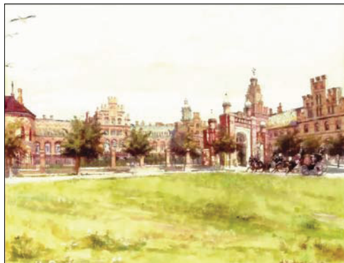
Палац єпископа. Акварель, гуаш. 1890

праці, які вона власноруч ілюструвала, посилалися ще на початку століття. Зустрічаємо цитування її творів і в наш час. До прикладу, робота Віктора Л. Герамба (місто Грац, Австрія), що вийшла 1912 року у збірнику «Wurter und Sachen» з посиланням на статтю художниці «Румунські селянські будинки на Буковині». Дослідження Кохановської-етнографа згадує й український етнолог Вікторія Грябан у дисертації 2002 року на тему «Релікції вогню у світогляді, звичаях і традиціях українців Буковини XIX-XX ст.».