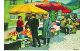
Роботи Владіміра Івасюка

Довідка: Розповідь про митця читайте в ч. 24 газети «Версії» за 2009 рік: Тетяна