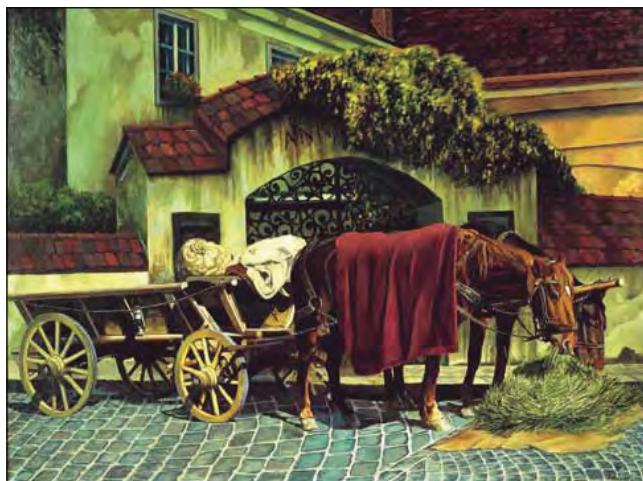
Володимир Івасюк. „Минуле“.

ЧЕРНІВЦІ. – Одного разу в інтернеті трапилось мені ім'я американського художника українського походження Володимира Івасюка. То було інтерв'ю його сина Гюсти-Вернера Івасюка, надруковане у газеті „Santa Paula Times“ 2009 року – спогад про життя і творчість художника й лікаря В. Івасюка (1905-1986), рідним містом якого були Чернівці.